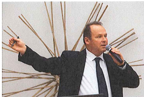
Gantrufener mit Strahlenkranz: Nationalrat Andreas Aebi wickelt Versteigerungen routinemässig ab – normalerweise als Viehauktionator.

Für die Auktion wurde bei allen 38 Werken ein Mindestpreis festgelegt. Dieser betrug 60 Prozent des Verkaufspreises. Auch war es möglich, bereits im Vorfeld via Internet mitzusteigern. Wie viele Werke an der Auktion schluss-