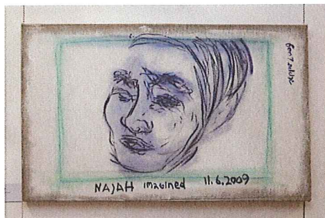
Dieses Werk ist schwer zu deuten: Mann oder Frau? Wach oder schlafend? Nachdenklich oder traurig? Ein Bild von Seppo Varradi.