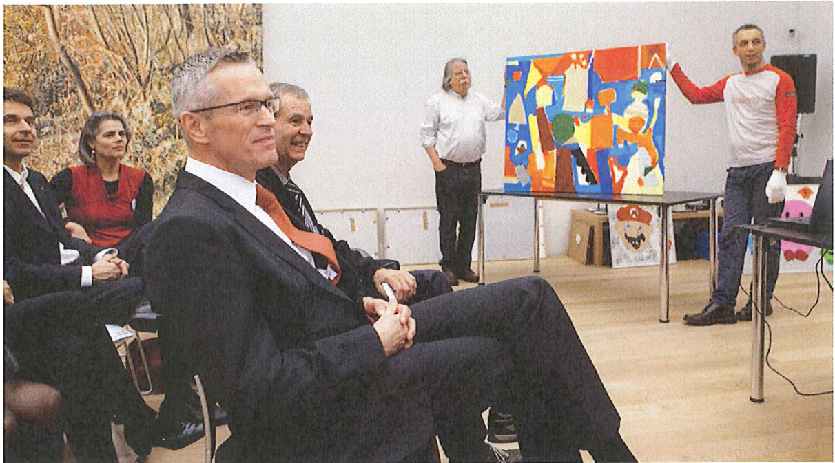
Wohltätige Kunstauktion mit einem hohen Gast: Anwesend war im Burgdorfer Museum Franz Gertsch gestern auch Ständerat Werner Luginbühl.