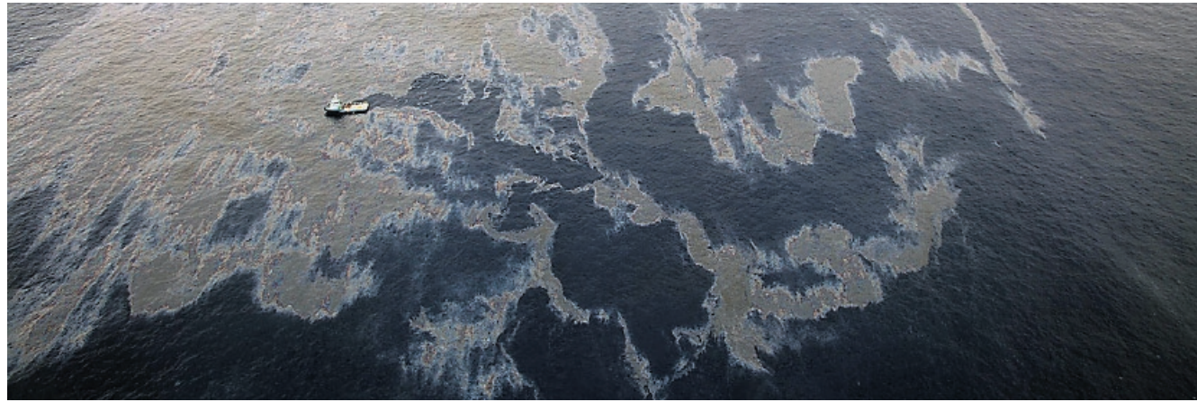
Ein Ölleck vor der brasilianischen Küste könnte Transocean viel Geld und zudem lukrative Aufträge kosten.