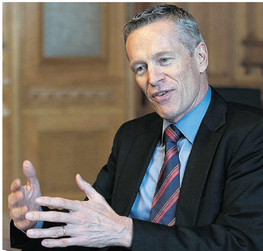
Der Berner Ständerat Werner Luginbühl will mit Fiskalregeln Politikversagen verhindern.

Ja, die Ratslinke spricht sich grundsätzlich gegen Schuldenbremsen aus. In der Kommission hat sich offenbar auch die SVP kritisch geäußert, im Rat die Motion aber dann unterstützt. Die Linke lehnt das Instrument ab, weil sie darin eine Entmündigung der Politik sieht. Zudem müssen bei der Schuldenbremse, wie sie im Bundeshaushalt oder in der Arbeitslosenversicherung angewandt wird, in der Regel